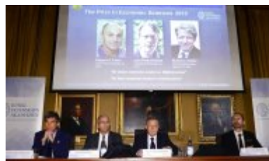
Nobel-vindere giver os vigtig viden om verden