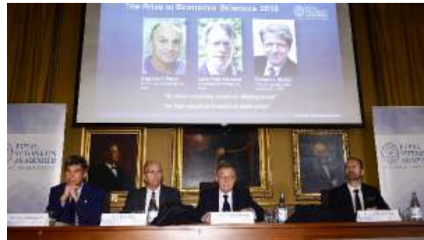
Her er vinderne af Nobelprisen i økonomi