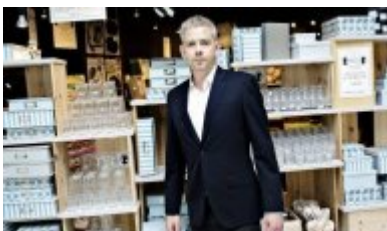
Broder Grene har dybe rødder