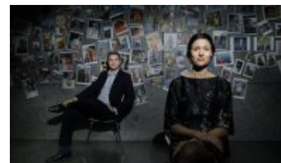
»Vi falder ikke på halen for Generation Y«